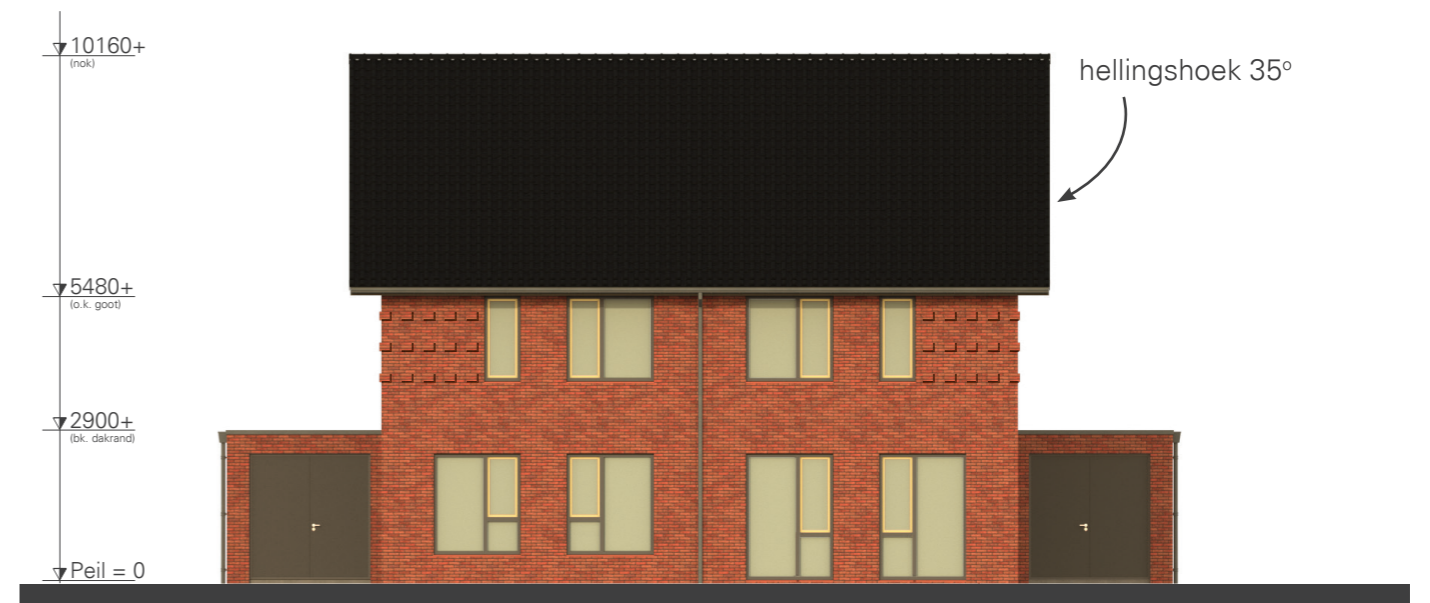
Woningtype 'De Zaaier'